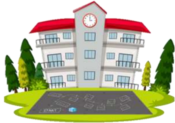
Педагогическая помощь в определении верного пути: как воспитывать, чему учить, как учить.

Семья и образовательные организации - два воспитательных феномена, каждый из которых по-своему дает ребенку социальный опыт, но только в сочетании друг с другом они создают оптимальные условия для вхождения маленького человека в большой мир.